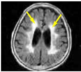
가 MRI ( ) 가 ( )